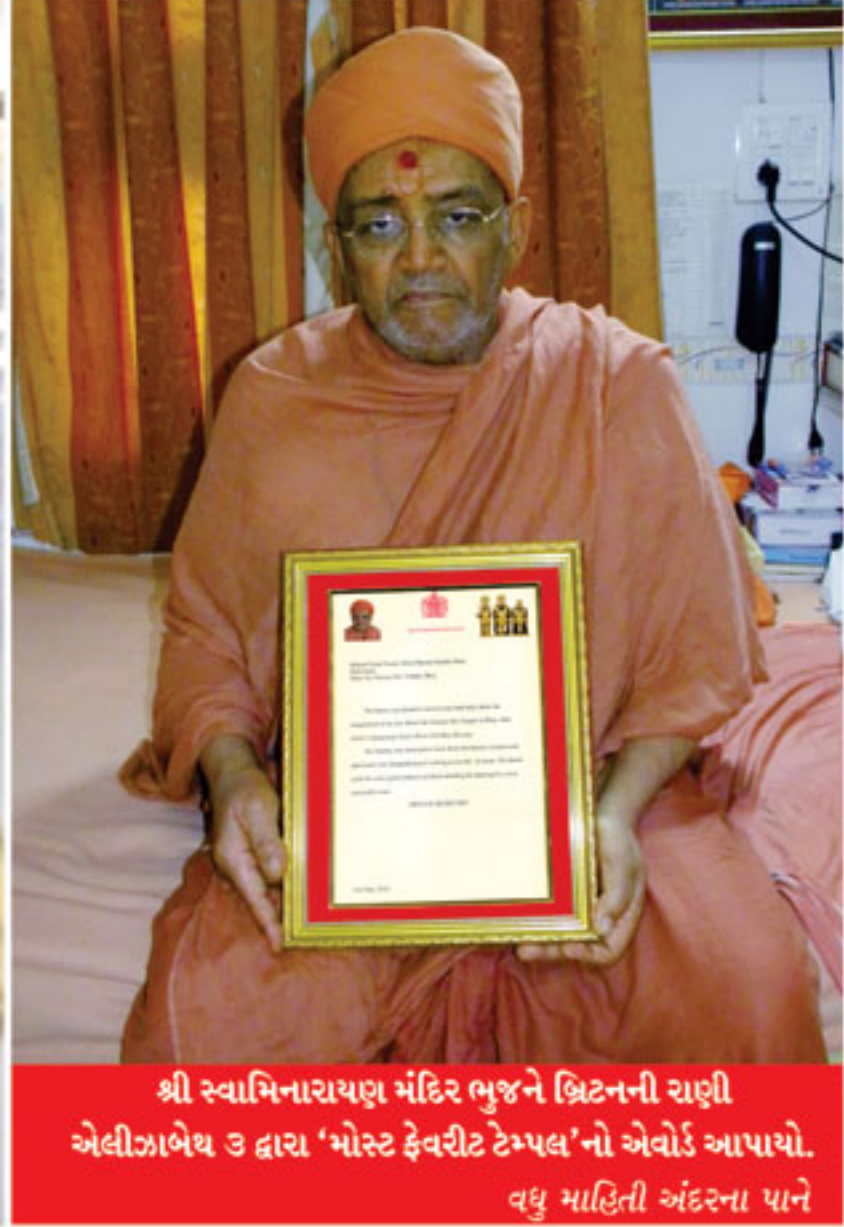
શ્રી સ્વામિનારાયણ મંદિર ભુજને બ્રિટનની રાણી એલીઝાબેથ ૩ દ્વારા 'મોસ્ટ ફેવરીટ ટેમ્પલ' નો એવોર્ડ આપાયો. વધુ માહિતી અંદરના પાને