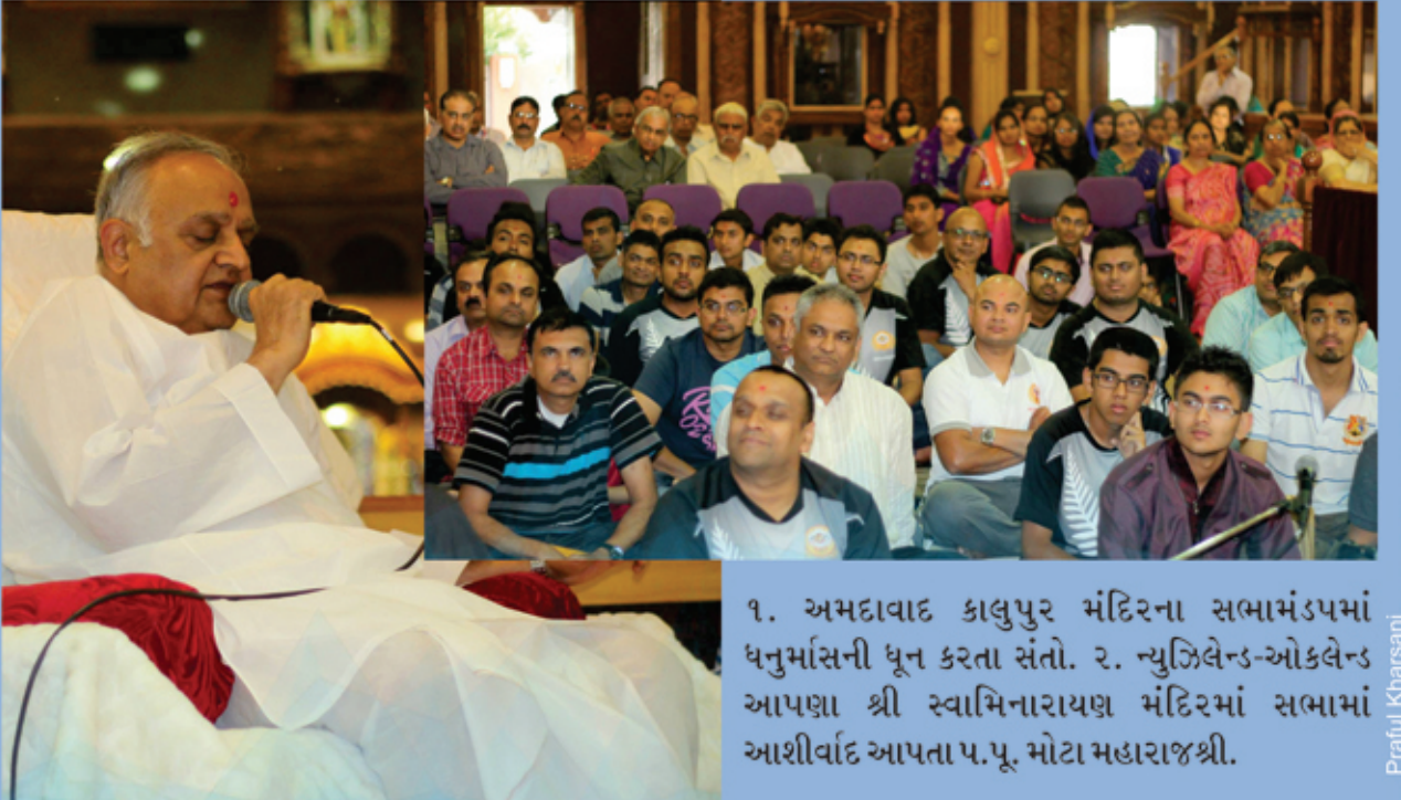
૧. અમદાવાદ કાલુપુર મંદિરના સભામંડપમાં ધનુર્માસની ધૂન કરતા સંતો. ૨. ન્યુઝિલેન્ડ-ઓકલેન્ડ આપણા શ્રી સ્વામિનારાયણ મંદિરમાં સભામાં આશીર્વાદ આપતા પ.પૂ. મોટા મહારાજશ્રી.