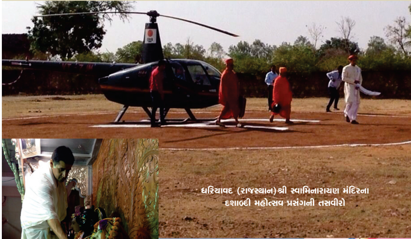
ધરિયાવદ (રાજસ્થાન) શ્રી સ્વામિનારાયણ મંદિરના દશાબ્દી મહોત્સવ પ્રસંગની તસવીરો